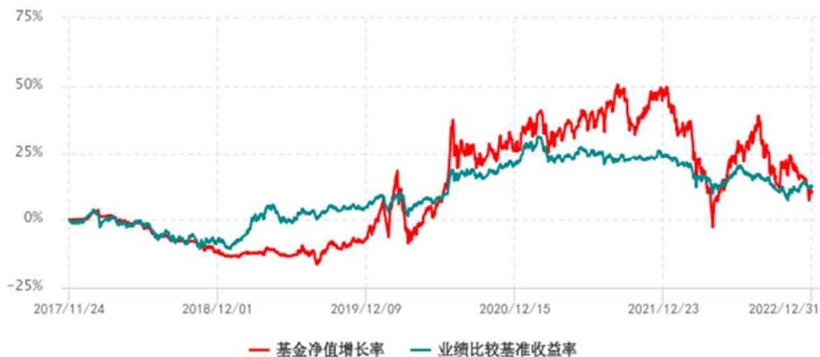
基金份额累计净值增长率与同期业绩比较基准收益率历史走势对比图 (2017年11月24日-2022年12月31日)

注：1、本基金成立于 2017 年 11 月 24 日；2、比较基准为沪深 300 指数收益率×50%+中证综合债指数收益率×50%。