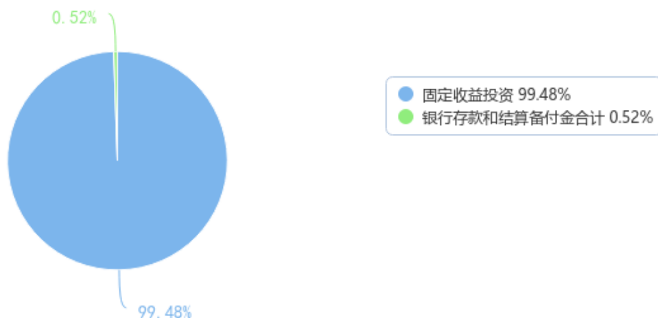
投资组合资产配置图表（数据截至日期：2022年06月30日）