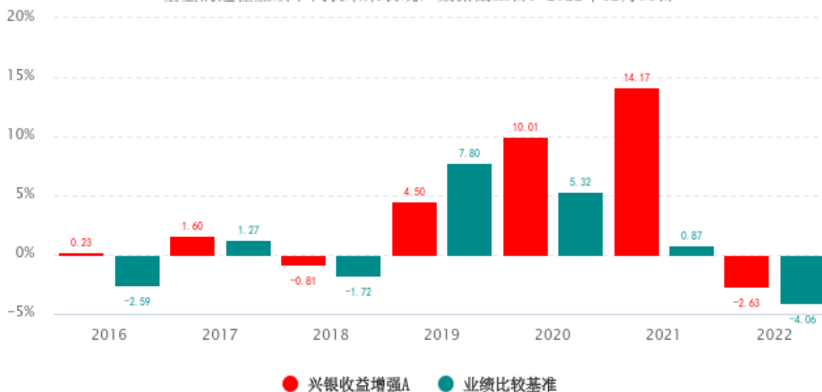
基金的过往业绩不代表未来表现，数据截止日：2022年12月31日