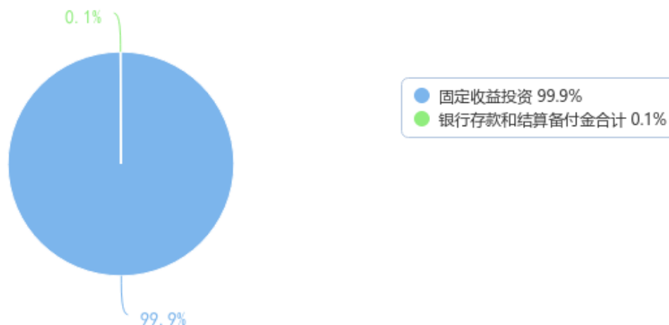
投资组合资产配置图表（数据截至日期：2023年06月30日）