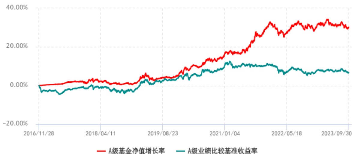
A 级基金份额累计净值增长率与同期业绩比较基准收益率历史走势对比图 (2016年11月28日-2023年09月30日)