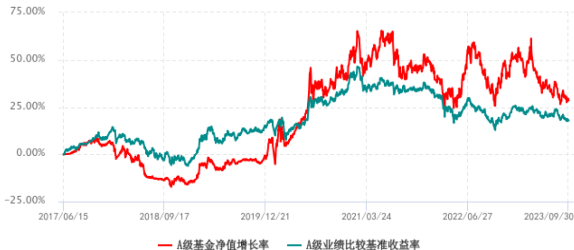
A级基金份额累计净值增长率与同期业绩比较基准收益率历史走势对比图 (2017年06月15日-2023年09月30日)