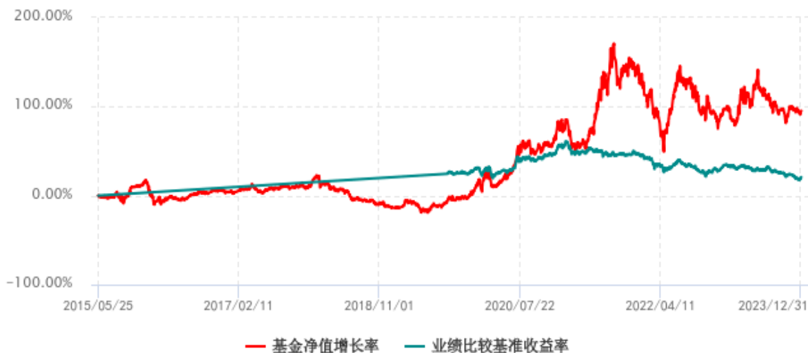
基金份额累计净值增长率与同期业绩比较基准收益率历史走势对比图 (2015年05月25日-2023年12月31日)

注：1、本基金成立于 2015 年 5 月 25 日； 2、比较基准为：五年银行定期存款利率（税后）+1%，按“365 天/年”计算。