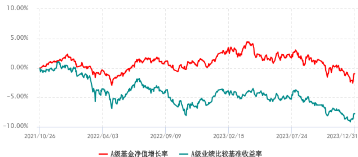
A 级基金份额累计净值增长率与同期业绩比较基准收益率历史走势对比图 (2021 年 10 月 26 日-2023 年 12 月 31 日)