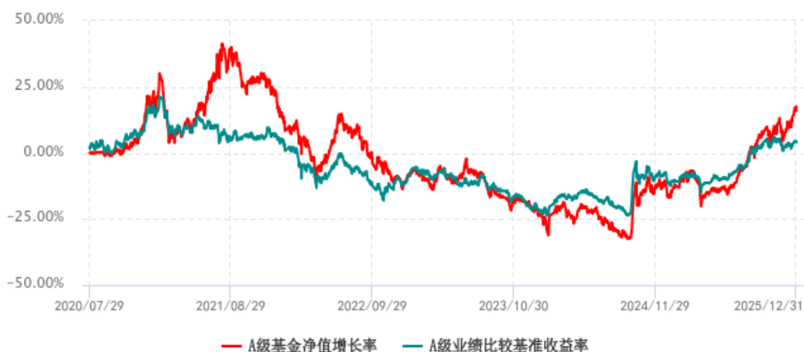
A级基金份额累计净值增长率与同期业绩比较基准收益率历史走势对比图 (2020年07月29日-2025年12月31日)