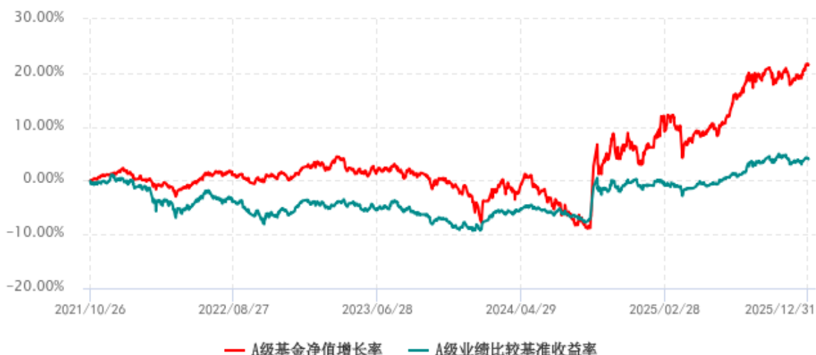
A级基金份额累计净值增长率与同期业绩比较基准收益率历史走势对比图 (2021年10月26日-2025年12月31日)