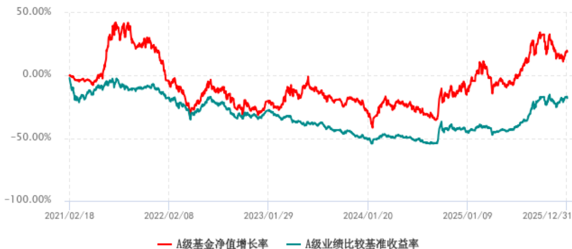
A 级基金份额累计净值增长率与同期业绩比较基准收益率历史走势对比图 (2021年02月18日-2025年12月31日)